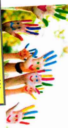
ГРАФИК ДЕЙНОСТИ - 01.07.2021 - 31.08.2021 г.